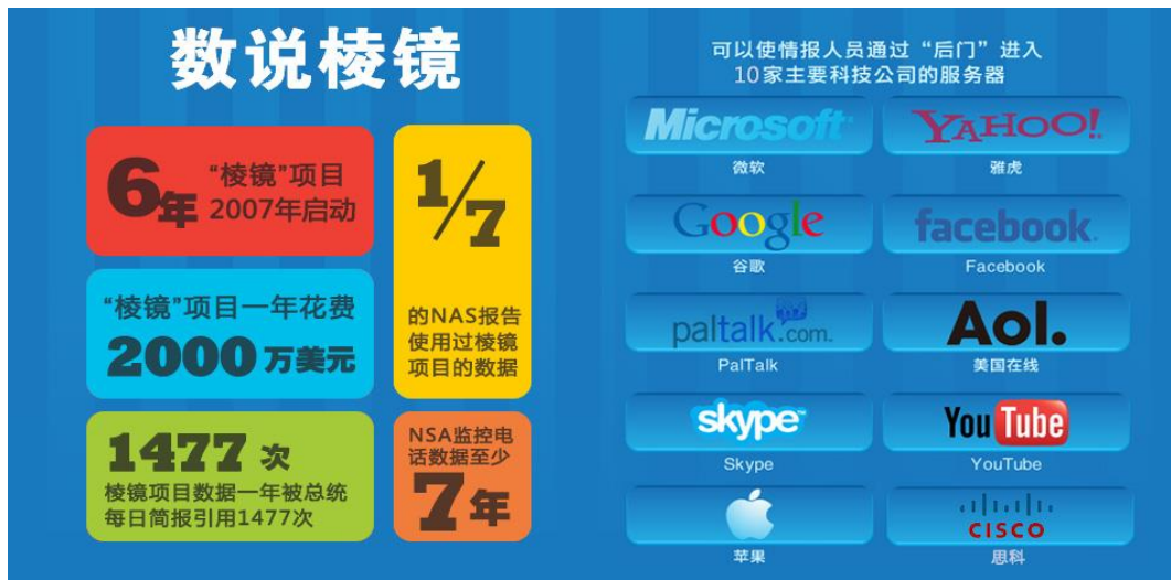
(2013年斯诺登“棱镜门”事件曝光推动网络安全上升到国家安全高度)

“棱镜门”以来，国家和行业对信息安全的重视逐渐加强，信息安全对一个国家的很多领域都是牵一发而动全身。从十八届三中全会设立国家安全委员会，到2014年中央网络安全和信息化领导小组宣告成立习近平亲自担任组长，表明了网络信息安全目前面临的形势任务复杂和所处地位的重要，也标志着中国已把网络信息安全列入了国家发展的最高战略方向之一。